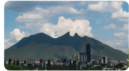
3ERA SESIÓN ESTATUTARIA MONTERREY 27 Y 28 DE NOVIEMBRE