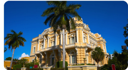
XXXV CONGRESO MEXICANO DE CARDIOLOGÍA MÉRIDA DEL 28 AL 31 DE OCTUBRE