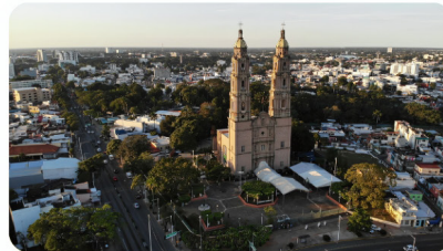
2DA SESIÓN ESTATUTARIA TABASCO 28 Y 29 DE MAYO