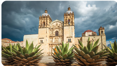
1ERA SESIÓN ESTATUTARIA OAXACA 6 Y 7 DE MARZO