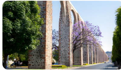
2DA SESIÓN ESTATUTARIA QUERÉTARO 7 Y 8 DE AGOSTO